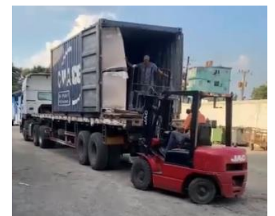
La livraison à Cuba le 29 août 2022