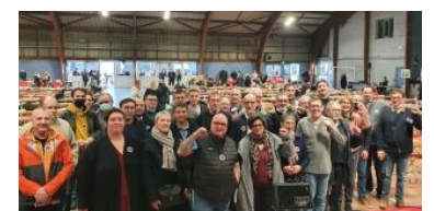
Les représentants des orga de la CGT

Festisol - Journée de l'Amérique Latine du 27 novembre 2022