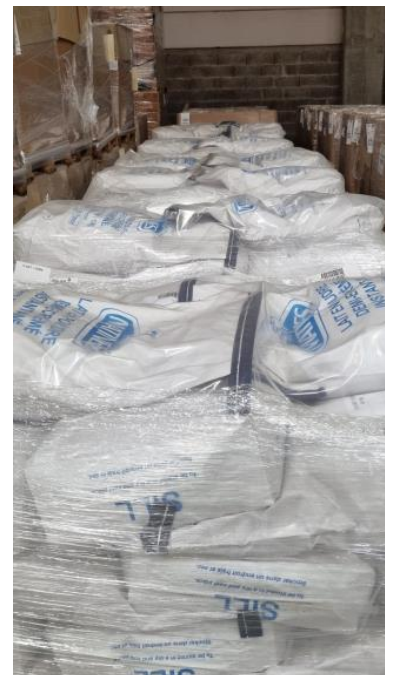
Le stockage avant expédition à Fos-sur-Mer

L'étranglement de toute une population est immoral et inhumain. Les organisations de la CGT membres de l'opération renouvellent leur exigence que la France s'implique plus fortement contre les lois extraterritoriales américaines et pour la levée du blocus contre Cuba.